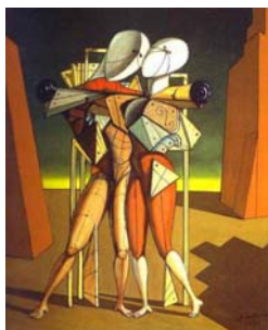
G. DE CHIRICO, Ettore e Andromaca , 1917